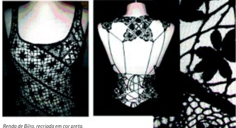
Renda de Bilro, recriada em cor preta.