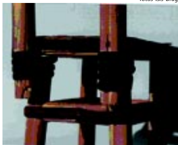
Detalhe da amarração dos pés e encosto